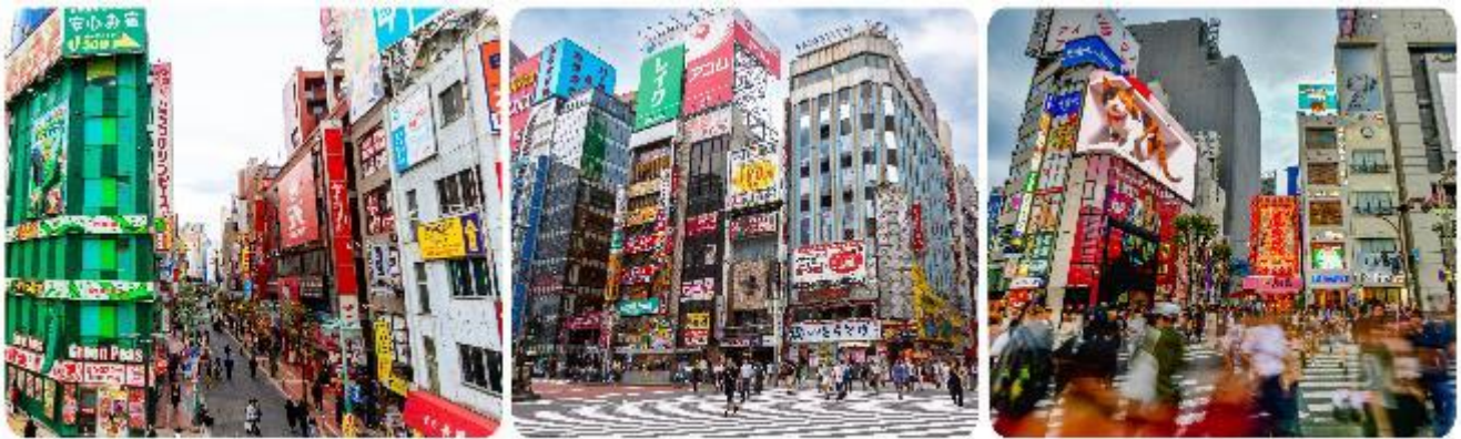
ช้อปปิ้งใจกลางกรุงโตเกียว - ชินจูกุ

มื้อกลางวัน บริการท่านด้วย ชุดอาหารญี่ปุ่นเบนโตะ