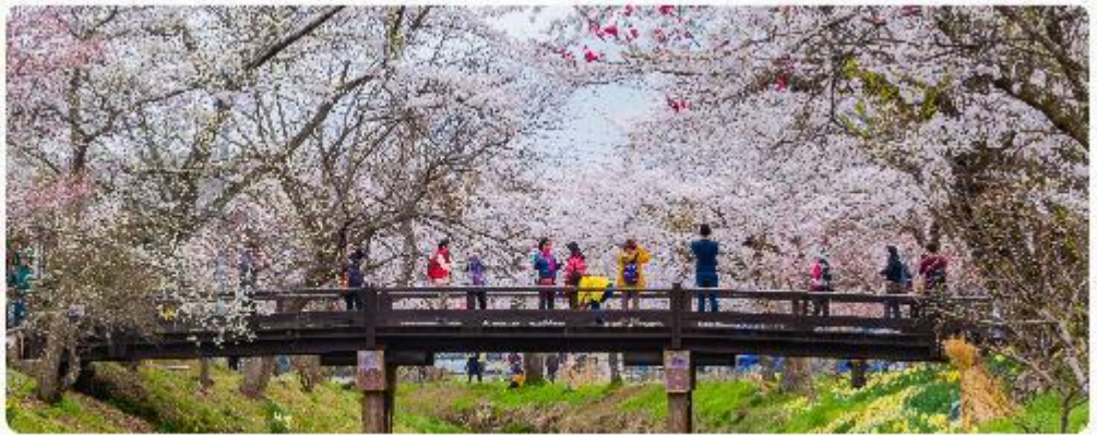
หมู่บ้านน้ำใสโอชิโนะ อักโก

โอชิโนะ อักโก หรือ ที่รู้จักกันในชื่อ หมู่บ้านน้ำใส ความงามแห่งธรรมชาติและวัฒนธรรมที่ซ่อนอยู่ใต้เงากุเขาไฟฟูจิโอชิโนะ อักโก ตั้งอยู่ในหมู่บ้านโอชิโนะ จังหวัดยามานาชิ ประเทศญี่ปุ่น เป็นแหล่งน้ำธรรมชาติที่มีชื่อเสียง ประกอบด้วยบ่อน้ำใสสะอาดทั้งแปดแห่ง ซึ่งน้ำในบ่อเหล่านี้เกิดจากการละลายของหิมะและน้ำแข็งจากกุเขาไฟฟูจิ น้ำที่ไหลลงมานั้นได้ถูกกรองผ่านชั้นหินกุเขาไฟ