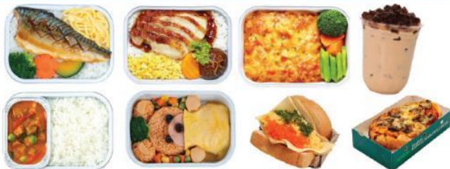
** ภาพเมนูตัวอย่าง รายการอาหารอาจเปลี่ยนแปลงได้ตามช่วงเวลา