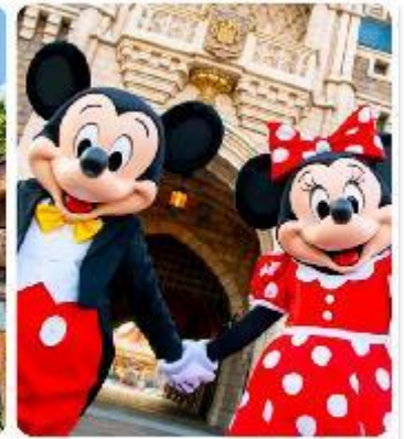
โตเกียวดิสนีย์แลนด์

แนะนำที่เที่ยว อิสระด้วยตัวเองเต็มวัน ! เลือกซื้อทัวร์เสริมอิสระดิสนีย์แลนด์ (ไม่มีหัวหน้าทัวร์และไม่มีไกด์นำเที่ยว) เอาใจแฟนพันธุ์แท้ของดิสนีย์ กับ สวนสนุกโตเกียวดิสนีย์แลนด์ ที่เต็มไปด้วยการผจญภัย ความสนุกสนานในโลกแฟนตาซีเมื่อเดินทางเข้าสู่ สวนสนุกโตเกียวดิสนีย์แลนด์ จะพบกับธีมพาร์คที่ แบ่งออกเป็น หลากหลาย เช่น Adventureland ที่เต็มไปด้วยการผจญภัยในป่าและน้ำตก, Fantasyland ดินแดนของตัวละครดิสนีย์ที่คุณหลงใหล, และ Tomorrowland ที่จะพาคุณไปสำรวจอนาคตที่เต็มไปด้วยนวัตกรรม นอกจากนี้เรายังเพลิดเพลินกับร้านอาหารและคาเฟ่รวมไปถึงของฝากจากดิสนีย์อีกมาย (ค่าทัวร์ยังไม่รวมบัตรค่าเช้า)