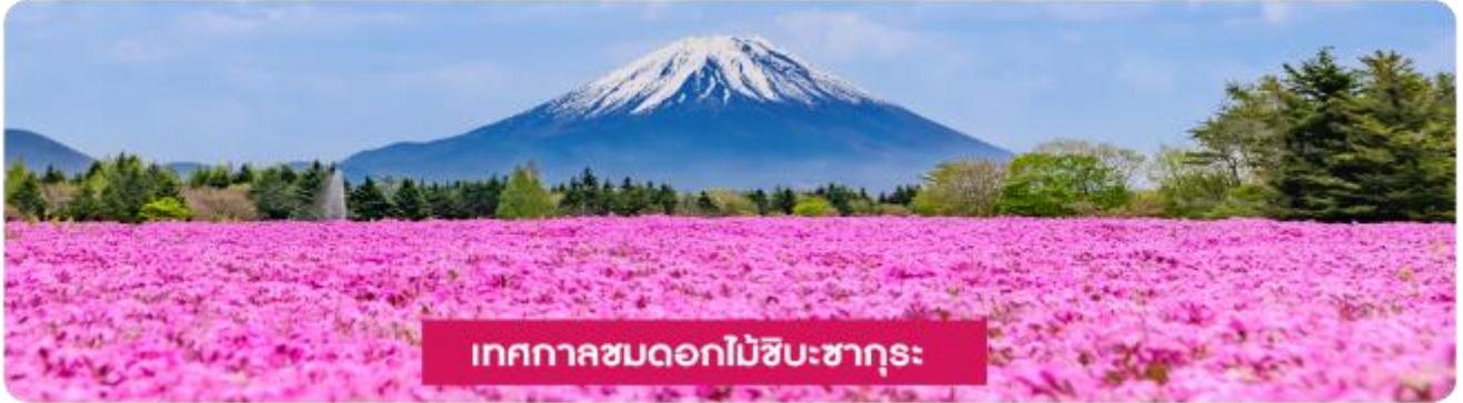
เทศกาลชมดอกไม้ชิบะซากุระ

เทศกาลชมดอกไม้ชิบะซากุระ (Shibazakura Festival) เป็นเทศกาลที่จัดขึ้นในช่วงฤดูใบไม้ผลิ เดือนเมษายนถึงพฤษภาคม โดยที่มีการจัดแสดงดอกชิบะซากุระ (หรือที่เรียกว่า "ดอกไม้มอส") ที่บานเต็มทุ่งหญ้า ดอกชิบะซากุระจะมีสีสันหลากหลาย เช่น สีชมพู ม่วง ขาว และแดง ซึ่งถือเป็นไฮไลท์ของในช่วงเทศกาลนี้ และจะได้เห็นทุ่งดอกไม้ที่กว้างขวางที่เรียงรายไปตามเนินเขาบรรยากาศที่สวยงามพร้อมกิจกรรมต่าง ๆ ให้ผู้เข้าชมได้เพลิดเพลิน เช่น การเดินเล่นในสวน ถ่ายรูป และการเพลิดเพลินกับวิวทิวทัศน์ที่สวยงามของภูเขาและธรรมชาติ