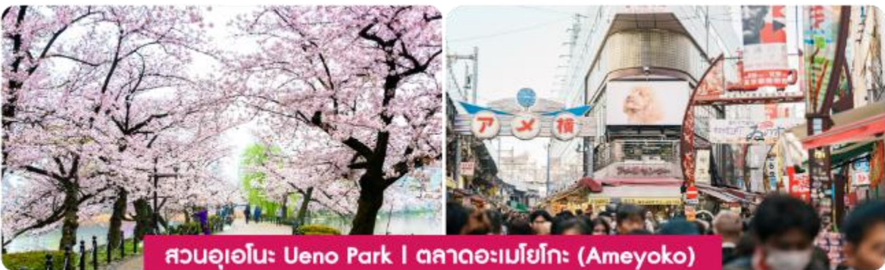
สวนอุเอโนะ Ueno Park | ตลาดอะเมโยโกะ (Ameyoko)

กรุงโตเกียว วัดอาซากุสะ วัดอาซากุสะ หรือเซ็นโซจิ เป็นวัดเก่าแก่และมีชื่อเสียงที่สุดในโตเกียวใน ย่านอาซากุสะ ภายในวัดมีรูปปั้นเจ้าแม่กวนอิม รวมถึงเจดีย์ห้าชั้น เมื่อเดินผ่านประตูคามินาริมงที่มีโคมแดงขนาดใหญ่ จะเจอกับ ถนนช้อปปิ้งนาคามิเสะ (NAKAMISE SHOPPING) ถนนช้อปปิ้งที่มีประวัติยาวนานใน ย่านอาซากุสะ และเต็มไปด้วยร้านค้าขายของฝาก ขนมหวาน และสินค้าพื้นเมืองญี่ปุ่น ที่นี่เราสามารถพบกับสินค้าหลากหลายชนิด หากมีเวลาขอพาทุกท่านไปยังจุดชมวิวยาม แม่น้ำสุมิเดะ (SUMIDA RIVER) ที่จะชวนให้เราเห็นวิวของ โตเกียวสกายทรี TOKYO SKY TREE พร้อมวิวทิวทัศน์ที่สวยงาม