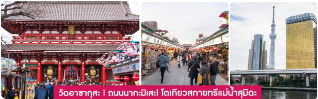
วัดอาซากุสะ | ถนนนากะมิเสะ | โตเกียวสกายทรีแม่น้ำสุมิเดะ

กรุงโตเกียว วัดอาซากุสะ วัดอาซากุสะ หรือเซ็นโซจิ เป็นวัดเก่าแก่และมีชื่อเสียงที่สุดในโตเกียวใน ย่านอาซากุสะ ภายในวัดมีรูปปั้นเจ้าแม่กวนอิม รวมถึงเจดีย์ห้าชั้น เมื่อเดินผ่านประตูคามินาริมงที่มีโคมแดงขนาดใหญ่ จะเจอกับ ถนนช้อปปิ้งนาคามิเสะ (NAKAMISE SHOPPING) ถนนช้อปปิ้งที่มีประวัติยาวนานใน ย่านอาซากุสะ และเต็มไปด้วยร้านค้าขายของฝาก ขนมหวาน และสินค้าพื้นเมืองญี่ปุ่น ที่นี่เราสามารถพบกับสินค้าหลากหลายชนิด หากมีเวลาขอพาทุกท่านไปยังจุดชมวิวยาม แม่น้ำสุมิเดะ (SUMIDA RIVER) ที่จะชวนให้เราเห็นวิวของ โตเกียวสกายทรี TOKYO SKY TREE พร้อมวิวทิวทัศน์ที่สวยงาม