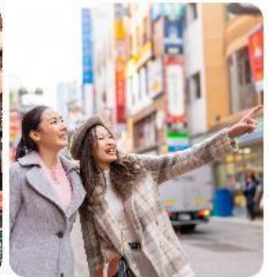
ช้อปปิ้งใจกลางกรุงโตเกียว