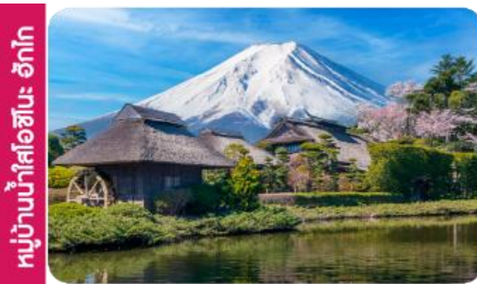
หมู่บ้านน้ำใสโอชิโนะ ฮักโก

เทศกาลชมดอกไม้ชิบะซากุระ (Shibazakura Festival) เป็นเทศกาลที่จัดขึ้นในช่วงฤดูใบไม้ผลิ เดือนเมษายนถึงพฤษภาคม โดยที่มีการจัดแสดงดอกชิบะซากุระ (หรือที่เรียกว่า "ดอกไม้มอส") ที่บานเต็มทุ่งหญ้า ดอกชิบะซากุระจะมีสีสันหลากหลาย เช่น สีชมพู ม่วง ขาว และแดง ซึ่งถือเป็นไฮไลท์ของในช่วงเทศกาลนี้ และจะได้เห็นทุ่งดอกไม้ที่กว้างขวางที่เรียงรายไปตามเนินเขาบรรยากาศที่สวยงามพร้อมกิจกรรมต่าง ๆ ให้ผู้เข้าชมได้เพลิดเพลิน เช่น การเดินเล่นในสวน ถ่ายรูป และการเพลิดเพลินกับวิวทิวทัศน์ที่สวยงามของภูเขาและธรรมชาติ