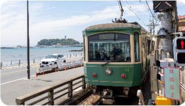
เมืองคามาคุระ