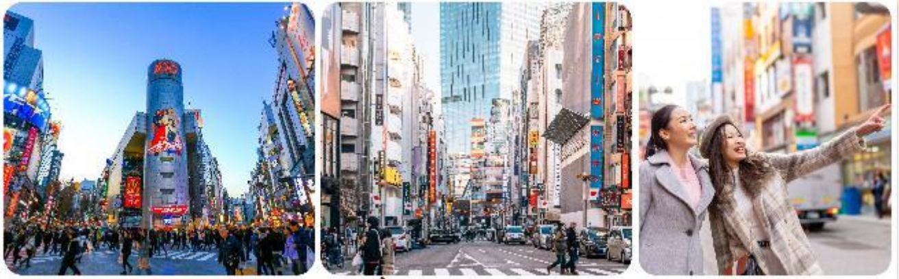
ช้อปปิ้งใจกลางกรุงโตเกียว