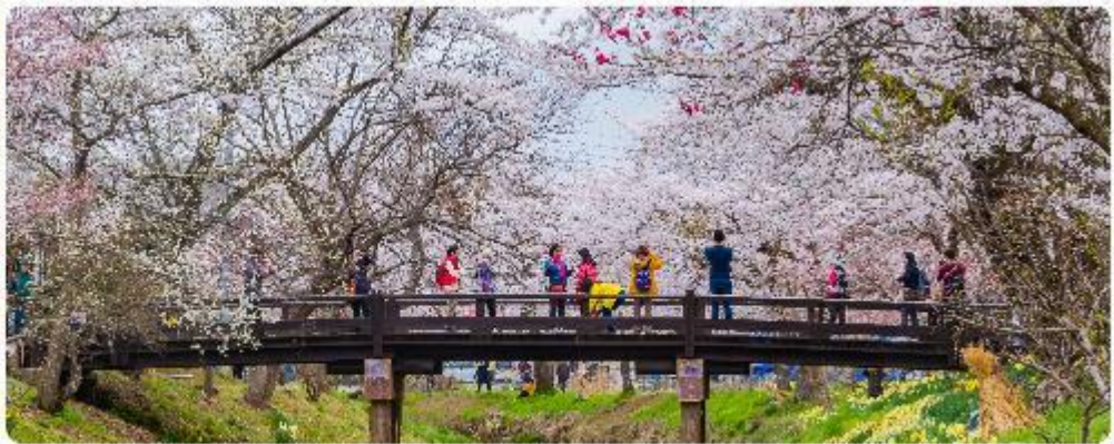
หมู่บ้านน้ำใสโอชิโนะ ฮักโก

โอชิโนะ ฮักโก หรือ ที่รู้จักกันในชื่อ หมู่บ้านน้ำใส ความงามแห่งธรรมชาติและวัฒนธรรมที่ซ่อนอยู่ใต้เงาภูเขาไฟฟูจิโอชิโนะ ฮักโก ตั้งอยู่ในหมู่บ้านโอชิโนะ จังหวัดยามานาชิ ประเทศญี่ปุ่น เป็นแหล่งน้ำธรรมชาติที่มีชื่อเสียง ประกอบด้วยบ่อน้ำใสสะอาดทั้งแปดแห่ง ซึ่งน้ำในบ่อเหล่านี้เกิดจากการละลายของหิมะและน้ำแข็งจากภูเขาไฟฟูจิ น้ำที่ไหลลงมานั้นได้ถูกกรองผ่านชั้นหินภูเขาไฟเป็นเวลาหลายปี จนทำให้น้ำในบ่อมีความบริสุทธิ์และใสจนเห็นถึงก้นบ่อ ไม่เพียงแต่ความงามของธรรมชาติที่ทำให้โอชิโนะ ฮักโกเป็นที่รู้จัก แต่ยังมีชื่อเสียงเกี่ยวกับวัฒนธรรมและประวัติศาสตร์ท้องถิ่นอย่างลึกซึ้ง หมู่บ้านนี้เป็นสถานที่ที่เราสามารถสัมผัสกับบรรยากาศที่เงียบสงบและงดงามของธรรมชาติ พร้อมกับเรียนรู้เรื่องราวและวิถีชีวิตดั้งเดิม สัมผัสวัฒนธรรมญี่ปุ่นที่แท้จริง