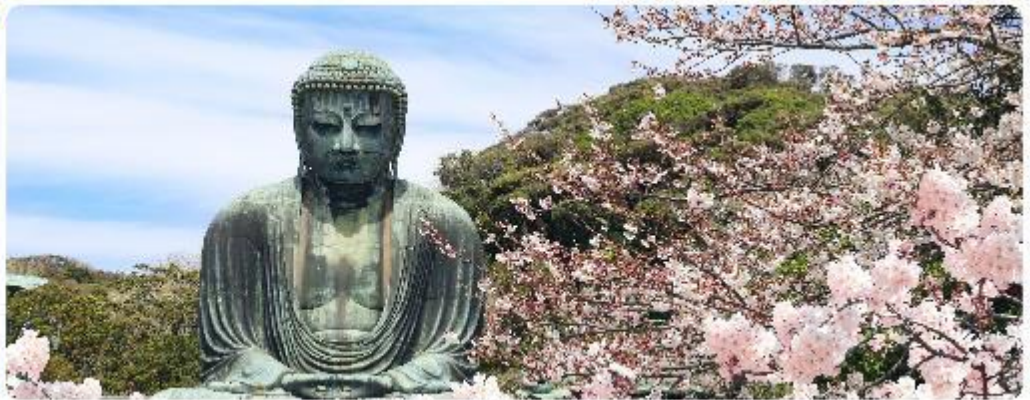
พระใหญ่ไดบุทสึ วัดโคโตคุอิน

จุดเด่นแห่งเมืองนี้คือ พระพุทธรูปองค์ใหญ่ไดบุทสึ (Daibutsu) หนึ่งในสัญลักษณ์ที่โดดเด่นที่สุดของ Kamakura พระพุทธรูปบรอนซ์ขนาดมหึมาที่วัดโคโตคุอิน (Kotoku-in) ที่มีความสูง 13.35 เมตร หนึ่งในพระพุทธรูปที่ใหญ่ที่สุดในญี่ปุ่น ไฮไลท์ของที่นี่คือการได้ชมความงดงามที่ตัดกันระหว่างพระพุทธรูปไดบุทสึขนาดใหญ่และต้นซากุระ ซึ่งปลูกอยู่ทั้งด้านหน้าและด้านหลังของพระพุทธรูป ทำให้เหมาะอย่างยิ่งกับการเดินเล่นและชมซากุระในบริเวณวัด เป็นอีกหนึ่งสถานที่ที่ต้องมาเยือนสักครั้ง หนึ่งในจุดไฮไลท์ของเมืองคามาคุระ คือ ไมโกลกันพาเอียน เกาะเอโนชิมะ (Enoshima) เป็นเกาะที่ตั้งอยู่ในจังหวัดคานากาวะ ประเทศญี่ปุ่น ซึ่งเป็นจุดหมายท่องเที่ยวยอดนิยมที่มีทิวทัศน์สวยงามและสถานที่ที่น่าสนใจมากมาย ทั้งชายหาด สวน และวิวทะเลที่งดงาม ในวันที่ท้องฟ้าโปร่งใสเรายังสามารถมองเห็นวิวของภูเขาไฟฟูจิได้อีกด้วย ด้านบนยังมี ศาลเจ้าเอโนชิมะ ที่มีความสำคัญในด้านความโชคดี โดยเฉพาะในเรื่องความรัก นอกจากนี้ยังมี หอคอยประภาคารเอโนชิมะ ที่ให้ทัศนียภาพ 360 องศา ของเมืองคามาคุระได้อีกด้วย