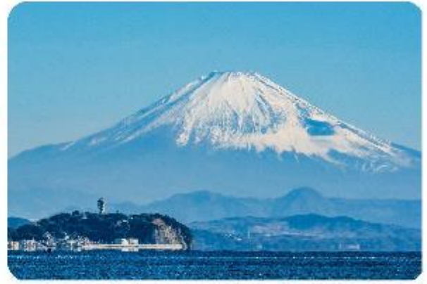
เกาะเอโนะชิมะ

เมืองคามาคุระ (Kamakura) เมืองน่ารักติดทะเล ตอบใจอยู่ที่เที่ยวที่ผสมผสานระหว่างประวัติศาสตร์ ธรรมชาติ และความงามของทะเล บอกเลยใครมาต้องตกหลุมรักกับเมืองสุดชิล อย่าง คามาคุระ เมืองเล็กๆ ที่ตั้งอยู่ทางตอนใต้ของจังหวัดคานากาวะ ห่างจากโตเกียวเพียงแค่ 1 ชั่วโมง เท่านั้น แต่เต็มไปด้วยสถานที่ท่องเที่ยว ทิวทัศน์ธรรมชาติ และชายหาดที่งดงาม ที่นี่จะทำให้ทุกคนรู้สึกเหมือนได้ย้อนกลับไปสัมผัสประวัติศาสตร์ญี่ปุ่นในยุคซามูไร พร้อมทั้งได้ผ่อนคลายท่ามกลางบรรยากาศที่เงียบสงบและสดชื่น