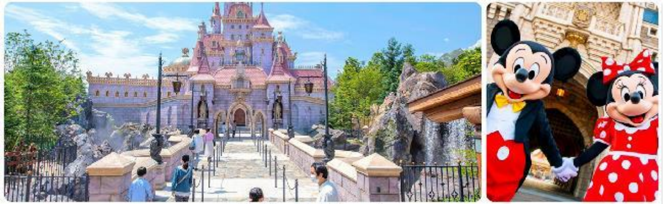
โตเกียวดิสนีย์แลนด์

แนะนำที่เที่ยว อิสระด้วยตัวเองเต็มวัน ! เลือกซื้อทัวร์เสริมอิสระดิสนีย์แลนด์ (ไม่มีหัวหน้าทัวร์และไม่มีไกด์นำเที่ยว) เอาใจแฟนพันธุ์แท้ของดิสนีย์ กับ สวนสนุกโตเกียวดิสนีย์แลนด์ ที่เต็มไปด้วยการผจญภัย ความสนุกสนานในโลกแฟนตาซีเมื่อเดินทางเข้าสู่ สวนสนุกโตเกียวดิสนีย์แลนด์ จะพบกับธีมพาร์คที่ แบ่งออกเป็น หลากหลาย เช่น Adventureland ที่เต็มไปด้วยการผจญภัยในป่าและน้ำตก, Fantasyland ดินแดนของตัวละครดิสนีย์ที่คุณหลงใหล, และ Tomorrowland ที่จะพาคุณไปสำรวจอนาคตที่เต็มไปด้วยนวัตกรรม และเปิดประสบการณ์ใหม่ที่ Tokyo Disney Sea ที่จะพาคุณไปผจญภัยยังโลกทะเลและการผจญภัยทางน้ำ นอกจากนี้เรายังเพลิดเพลินกับร้านอาหารและคาเฟ่รวมถึงของฝากจากดิสนีย์อีกมากมาย (ค่าทัวร์ยังไม่รวมบัตรค่าเข้า)